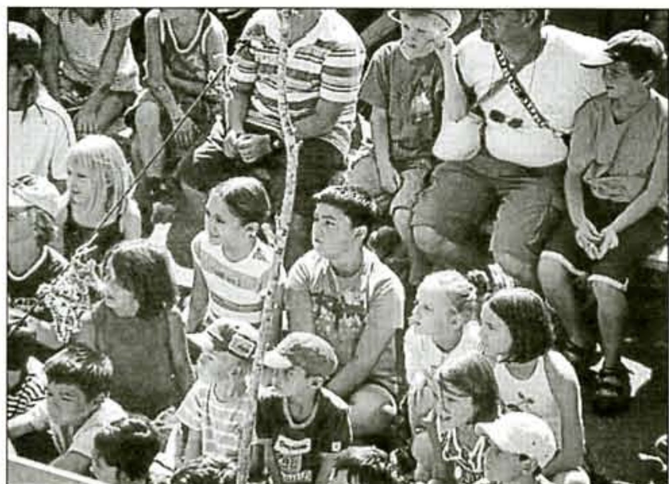
■ Un public conquis