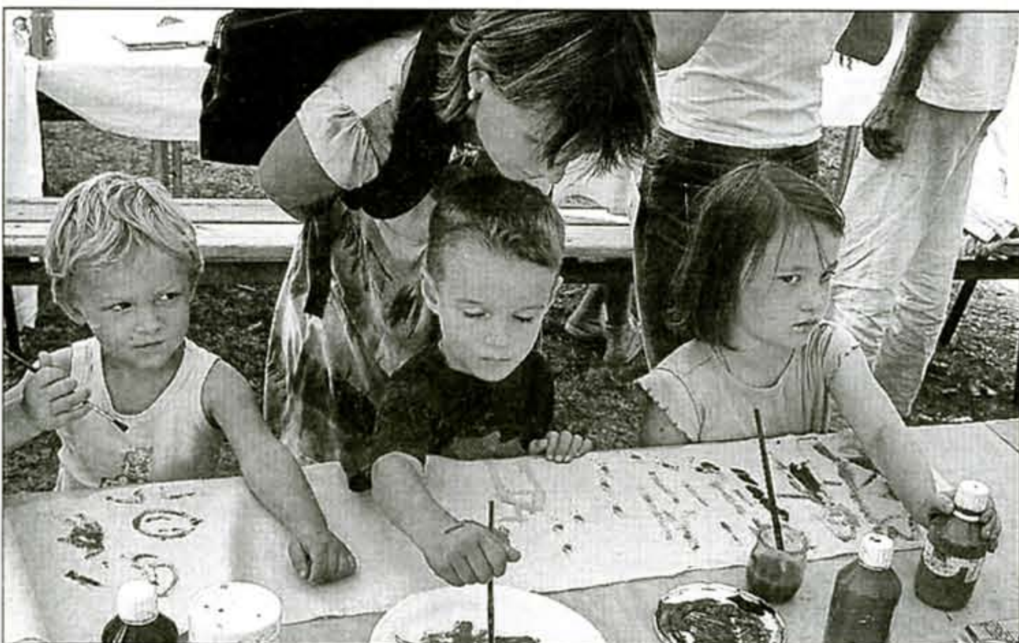
■ Il y avait des ateliers

ans déjà. Dimanche, en fin de journée, tout le monde est heureux : les enfants bien sûr à qui la fête était dédiée, leurs parents ravis par la qualité de l'accueil et des prestations, les organisateurs fourbus mais fiers d'avoir accompli une si belle mission. Qu'on se le dise : des idées trottent déjà sous les chapeaux et les frisettes pour le Festival 2010 !