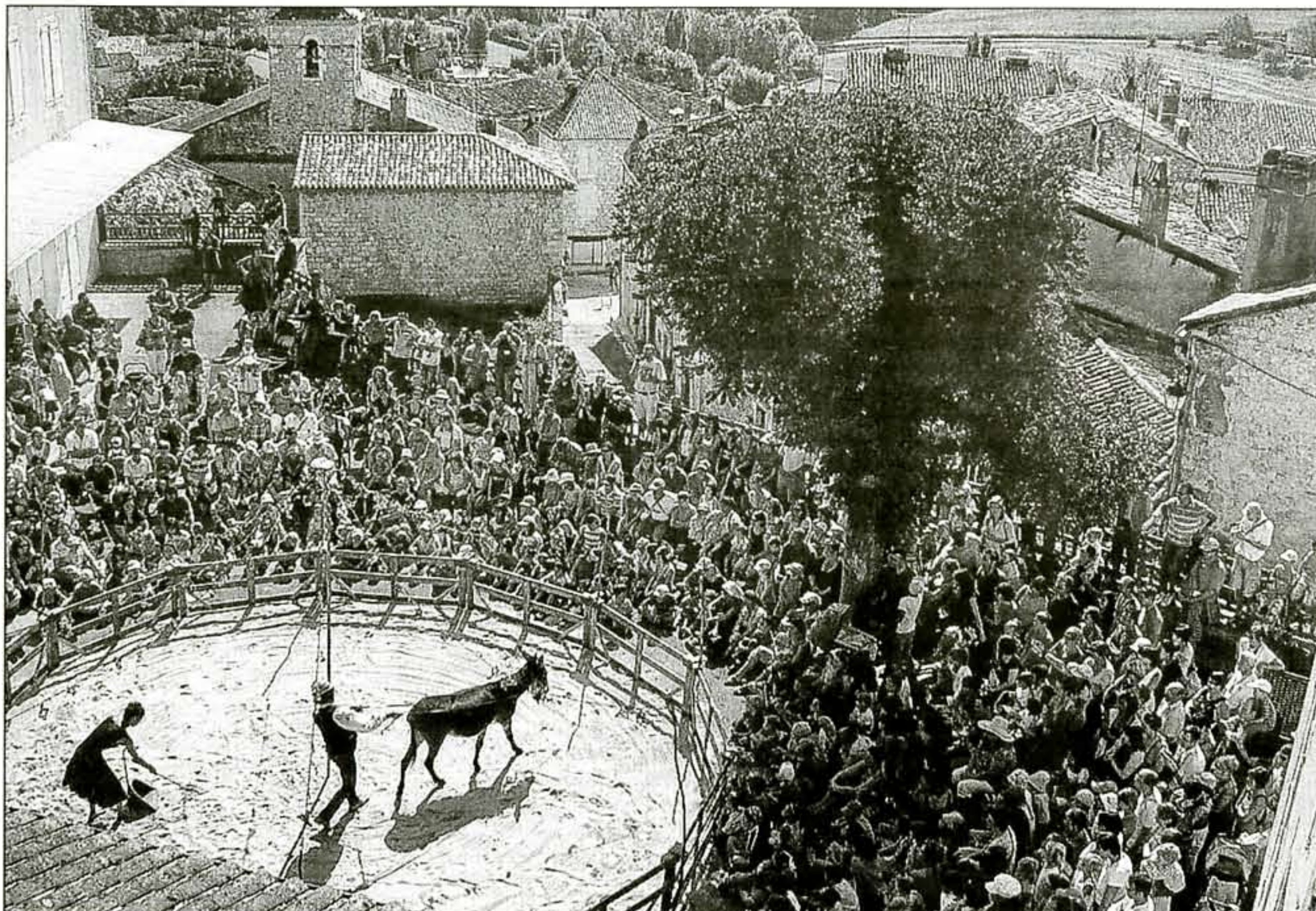
■ Le collège investi par les ânes

Un peu plus loin, sur la place du Midi, c'est une dame à fou-